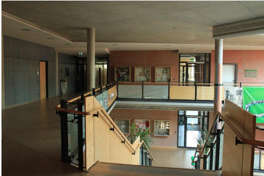
Eine Schule des Wohlbefindens